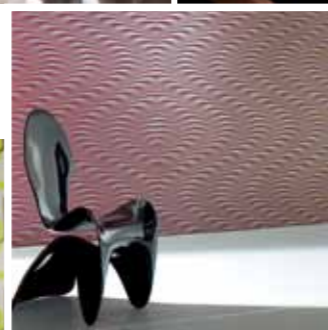
Luigi Colani Collection by marburg wallcoverings