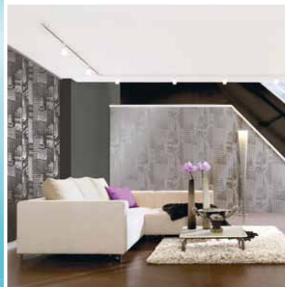
Kollektion Manhattan – AS Création

Wand. Der Untergrund wird dabei nicht beschädigt und ist direkt bereit für die nächste Tapezierung. Öfter mal Tapetenwechsel, kein Problem! Vliestapeten sind dimensionsstabil, brauchen keine Weichzeit, sind schwer entflammbar, haben eine hohe Dampfdurchlässigkeit, sind weitgehend reissfest und biologisch abbaubar.