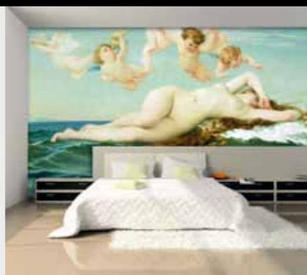
Erfurt und Sohn

Ein Schuss Inspiration und das nötige Flair genügen, um mit einer einzelnen Wand oder gar nur mit drei, vier Tapetenbahnen spannende Akzente zu setzen. Der Digitaldruck macht's möglich. Ob Ferienstimmungen, ob abstrakte Computer-Kompositionen, ob künstlerische Szenarien, alles kann in der Regel massgenau in der Wunschgrösse geliefert werden. Die Auswahl an fertigen Motiven ist in jeder Sparte sehr gross, zudem besteht die Möglichkeit, eigene Kreationen zu verwirklichen.