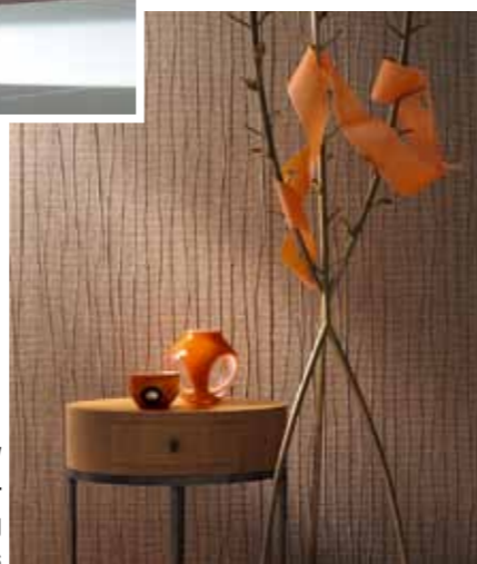
Wall Couture by Ulf Moritz – marburg wallcoverings

langwierige Arbeit mit mühsamen Abkratzen und mit Dampfapparat. Das war einmal – mit der Papiertapete. Heute hat sie ausgedient und wurde durch die Vliestapete abgelöst. Diese hochbiologische